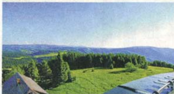
▲ Fernblick vom Aussichtsturm auf dem Brend

Entlang der europäischen Wasserscheide zur Elz- und Bregquelle