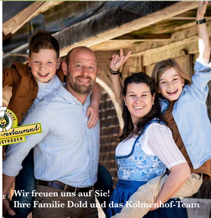
Wir freuen uns auf Sie! Ihre Familie Dold und das Kolmenhof-Team